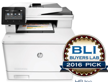
HP Inc. HP Color LaserJet Pro MFP M477 Imprimante couleur multifonction exceptionnelle pour les petits groupes de travail