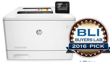
HP Inc. HP Color LaserJet Pro M452 Imprimante couleur exceptionnelle pour les petits groupes de travail