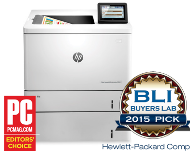
Hewlett-Packard Company HP Color LaserJet Enterprise M553 Imprimante couleur exceptionnelle pour les groupes de travail moyens et grands