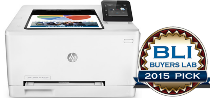
Hewlett-Packard Company HP Color LaserJet Pro M252dw Imprimante couleur exceptionnelle pour les petits bureaux et bureaux à domicile les groupes de travail moyens et grands