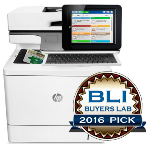
HP Inc. HP Color LaserJet Enterprise MFP M577 Imprimante couleur multifonction exceptionnelle pour les grands groupes de travail

Documents de qualité professionnelle sans attendre