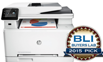
Hewlett-Packard Company HP Color LaserJet Pro MFP M277dw Imprimante couleur multifonction exceptionnelle pour les petits bureaux et bureaux à domicile