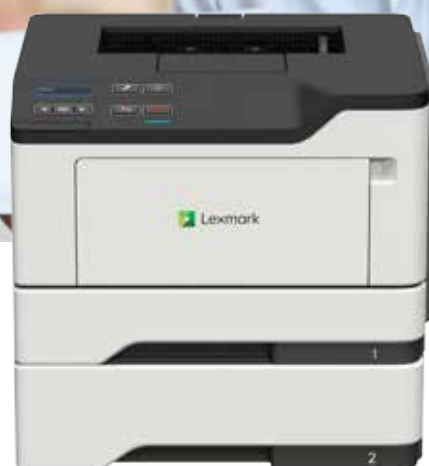
B2338dw avec bac d'alimentation en option